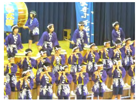
< 5・6年干拓太鼓演奏 >

3・4年生の合奏や合唱では、指揮に合わせてすてきな音や歌声が響いていました。23代目となる5・6年生の干拓太鼓の演奏は、迫力と伝統を感じさせるものでした。そして、4年生は、新たな試みとして干拓劇の発表です。紫雲寺の干拓の歴史を分かり易く伝えてくれました。