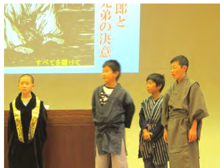
< 4年干拓劇発表 >