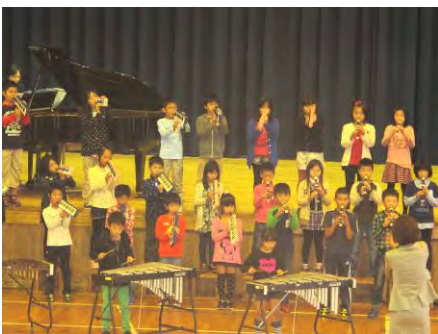
< 3・4年音楽発表 >