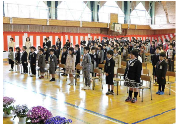
背筋びしっ、の1年生

▲翌、4月7日（火）、5、6年生が中心になって準備を整えてくれた体育館で、入学式が始まりました。校歌斉唱のとき、4年生が大きな歌声を体育館いっぱい響かせてくれました。2、3年生がダンス『妖怪体操』を一生懸命披露すると1年生がとびっきりの笑顔を見せてくれました。また、入学式後の職員紹介で、驚きのできごとがありました。職員が一人一人挨拶をするとそれに対して子どもたちが大きな声